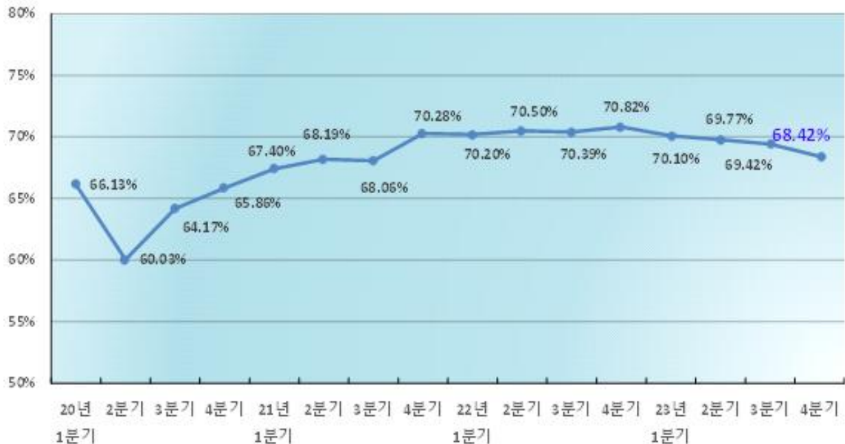
분기별 가동률 현황