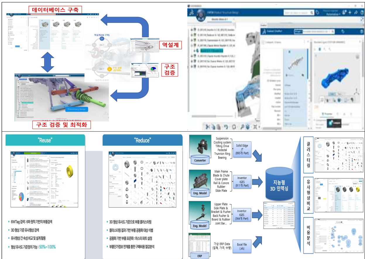
<부품 공동활용 지원 플랫폼>