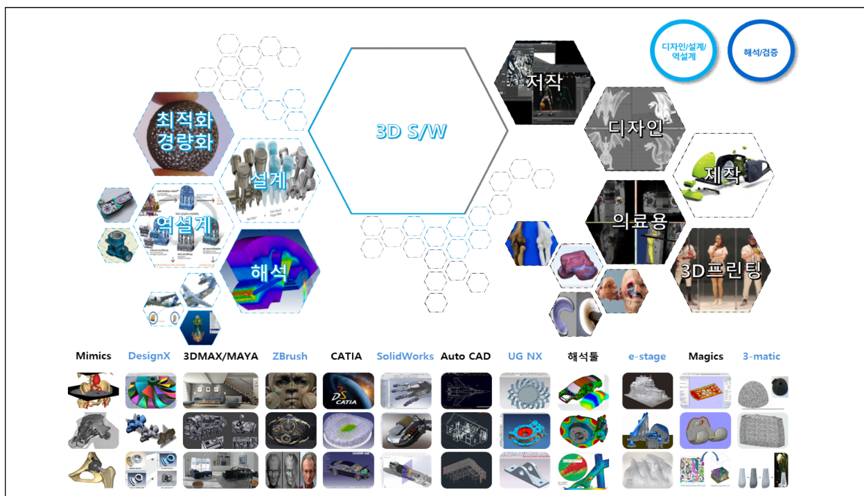
<디자인, (역)설계, 해석 SW 보유 현황>