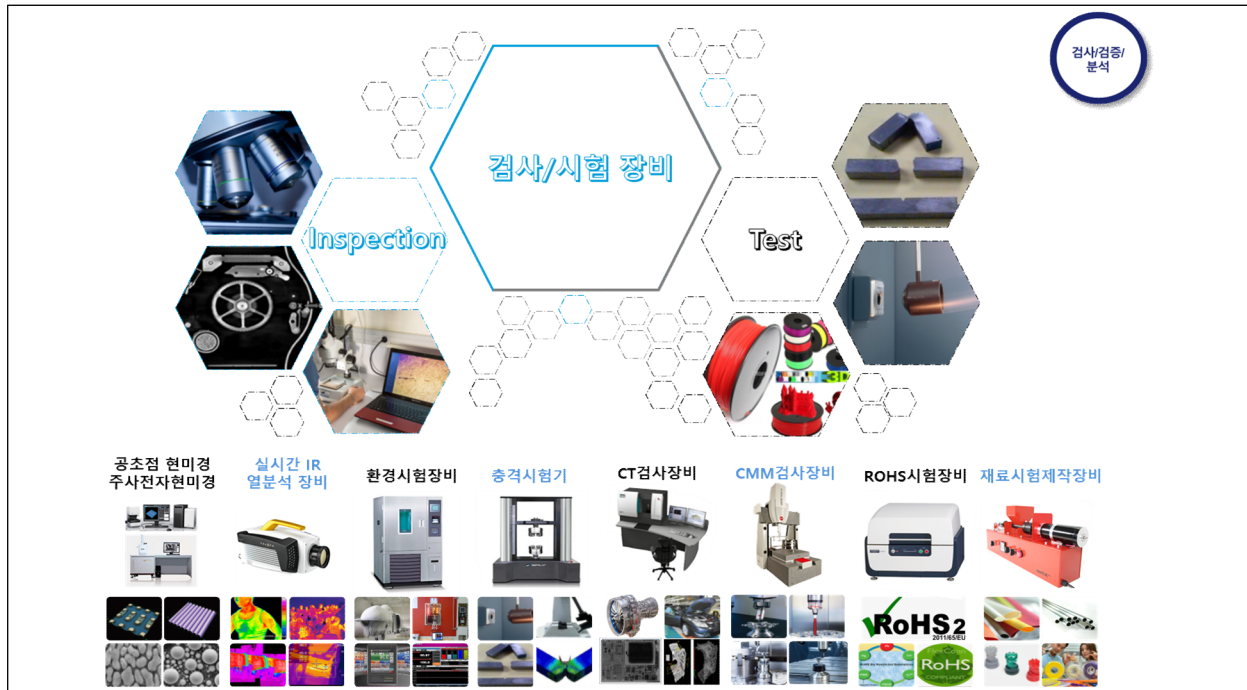
<검사 및 시험 장비 보유 현황>