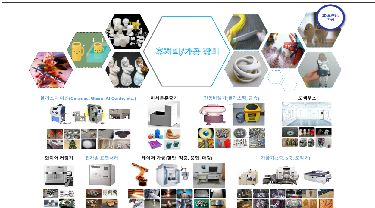
<후처리 및 가공 장비 보유 현황>