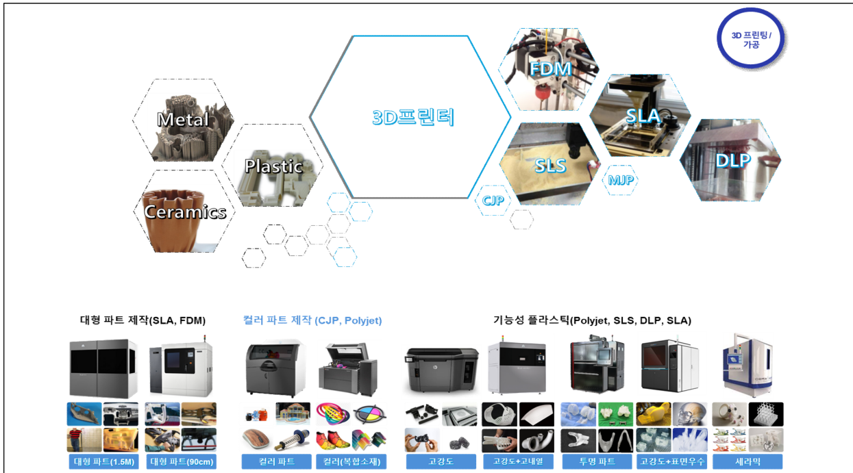
<3D프린팅 장비 보유 현황>